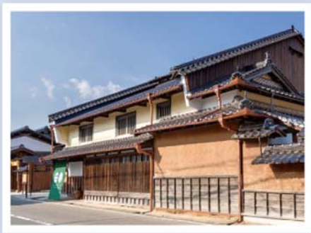
▲▶ 竹田城 城下町 ホテルEN (えん)