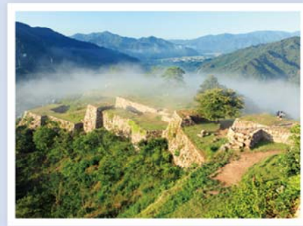
▲ 竹田城跡