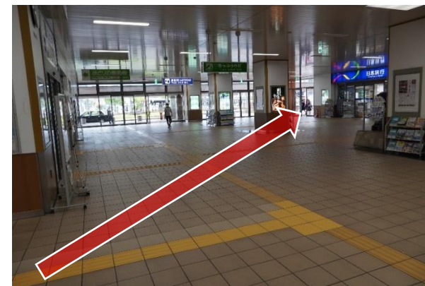
②日本旅行Tis福知山支店の左側の出口から出て真っすぐ進んでください。