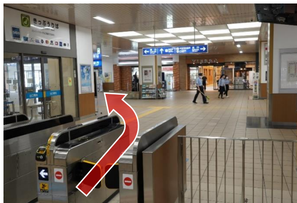
①改札を出て左側（南口方向）に進んでください。