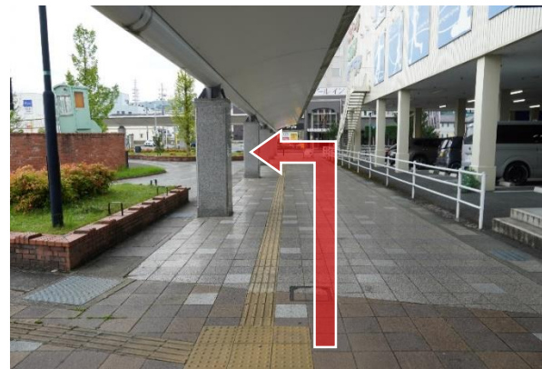
④突き当りを左折したら、バス乗り場が右側にあります。