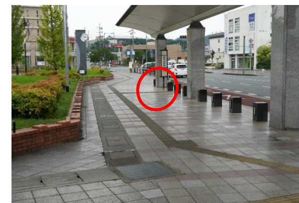
バス乗り場 (間隔をあけてお並びください)