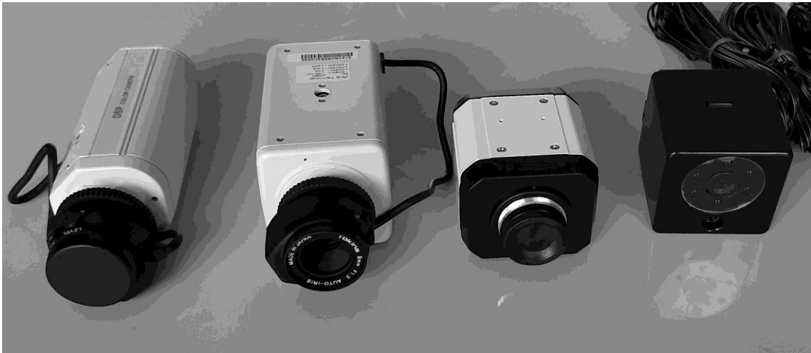
図 3 使用したカメラ