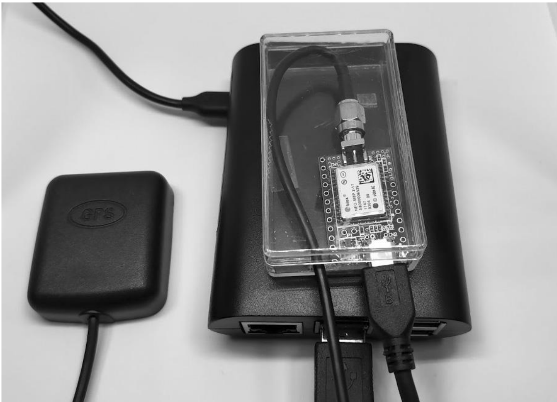
図 4 基準局装置外観