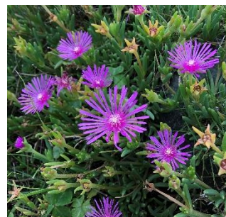
(撮影場所: 京都府福知山市宇堀)

との晴まとの しエれ私う花は福晴 よネたた開マ知天 う。ル日ちきツ山の 。ギにも、バ市ある ーはマ日ギ内る日 を外ツがクのー たにバ隠。一 っ出ギれ日角 ぷてク、るのに り、をを見閉を いお日習と光咲 たさい、いて浴 だき、てびい くま、するた