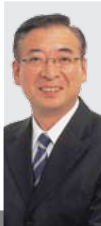
吉本秀樹 伊根町長