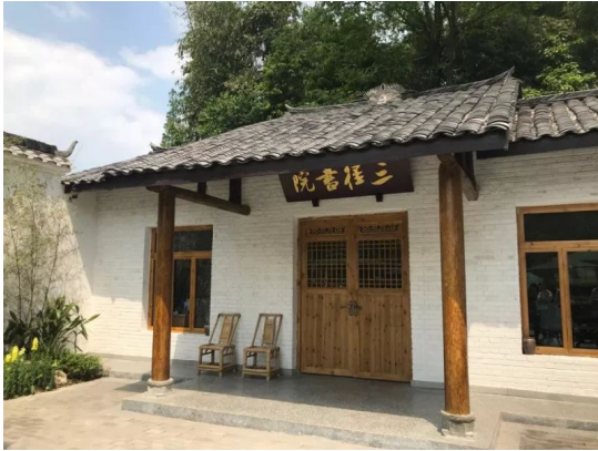
図 5. 三径書院