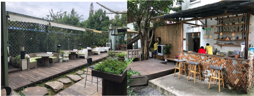
図1 3. 三聖花郷（五金花）村のレストラン（婚約パーティーなども行われるという）