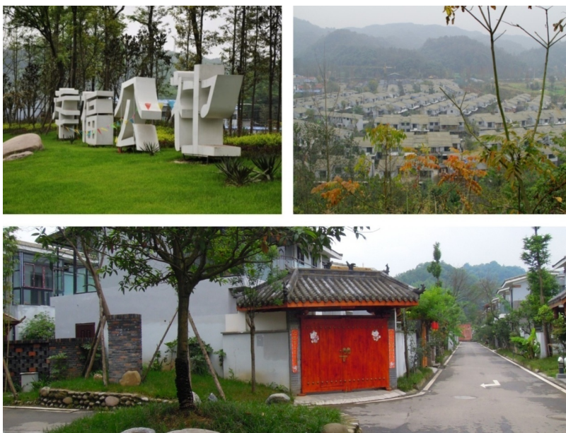
図 11 第一段階投資後の幸福公社

第三段階は農業基地への投資である。土地面積は約 130 ムーで、現在企画中である。住宅マンションの建設と共に、体験農場、コミュニティ広場、ジム、図書館、バドミントン練習場、テニスコート、サッカー球場、マウンテンバイクコース、医療保健センターなどの施設の建設も行っている。