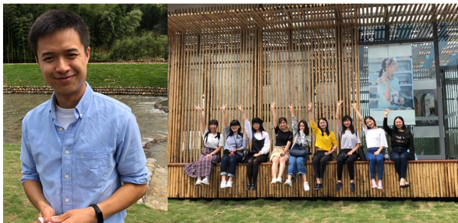
図17. 左：村に移住した30代の写真家 右：写真家の美術館の前で（日中の学生達）