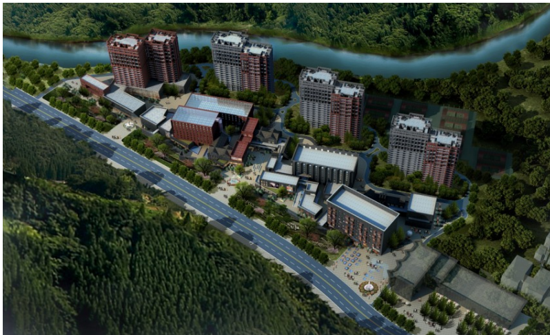
図 12 第二段階、リゾート地投資 完成後イメージ図

住民向けに、体育祭、芸術祭、民俗講座等を定期的に開催する。住民は無償で参加できる。