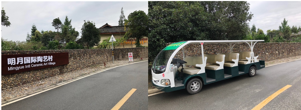
図15. 左：明月村入口 右：観光用バス