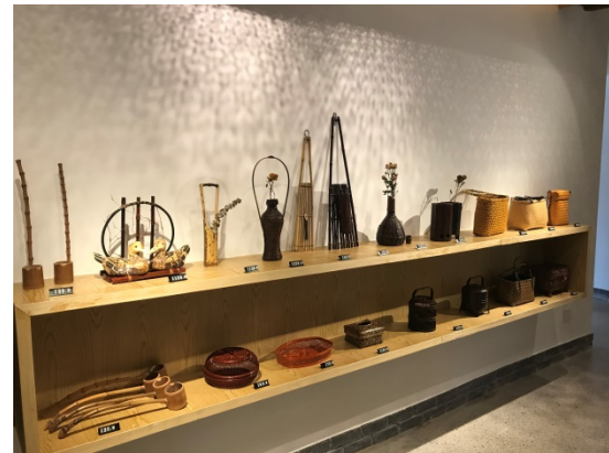
図 9. 竹工芸博物館内展示エリア

現在、市場で流通している道明竹工芸の種類は約 4000 個、四川省全市場の 90%以上の竹製のハコは道明鎮産である。時代に合わせて、道明鎮の若い世代の竹工芸職人は現代のテイストを取り入れ、伝統工芸と現代アートとを融合し、斬新な竹工芸製品を開発し、現代の消費者に受け入れられた。また、美術大学の工芸研究講師を招き、村民に対して、新たな竹工芸の手法、工程を教え、竹工芸の製品の工芸性を高めた。以前、村民の竹工芸製品は比較的荒く、収入にならなかったが、最新の作り方を取り入れた後、製品の芸術価値を高めることができ、収入が大幅に上昇した。従来の農産品だけでなく、家具、竹工芸のおしゃれバック、ライト、茶器、絵等も作成するようになった。