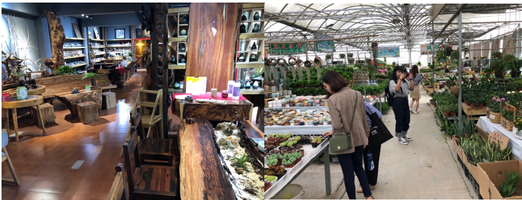
図1 4. 左：木工店（外国からの輸入木材も使う、高級家具修復も手がける） 右：花市場（地元で栽培した花を、外部だけでなく、市民にも売っている、雲南省など外部からの買い付けも行う）