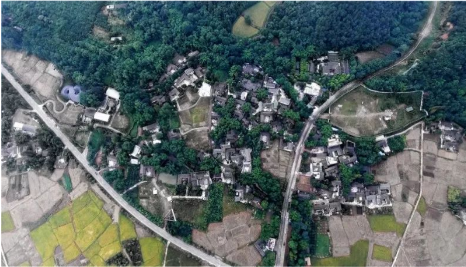
図1.道明竹芸村全貌（崇州市農商文旅体融合發展産業園）

道明竹芸村に対する投資主体は崇州市崇中展業投資有限公司（国有投資企業）（以下は中業投資）である。中業投資は不動産投資、文化観光、工業インフラ整備、商業施設管理を軸とするグループ企業である。