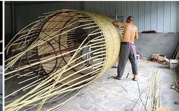
図 7. 竹工芸製品制作風景