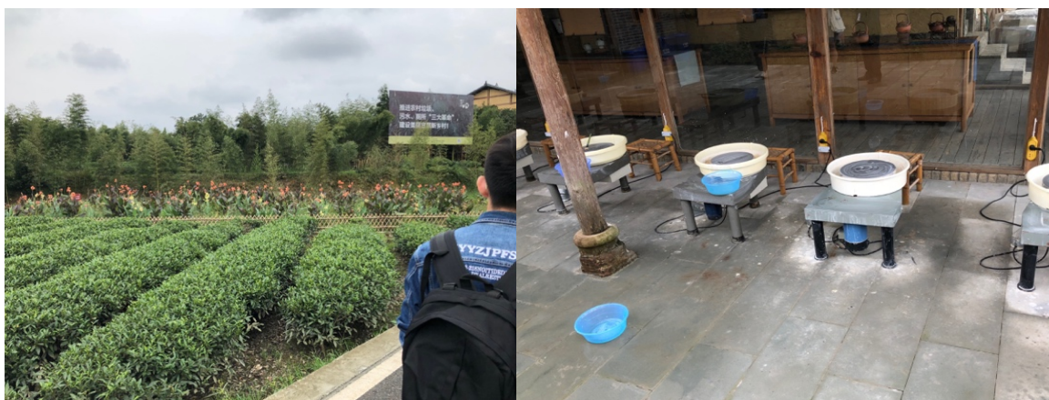
図16. 左：豊かな農園 右：陶芸体験教室