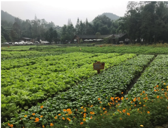
図 8. 無農薬野菜畑