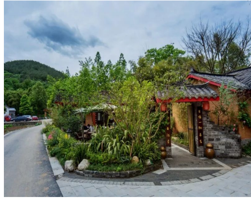
図 6. レストラン