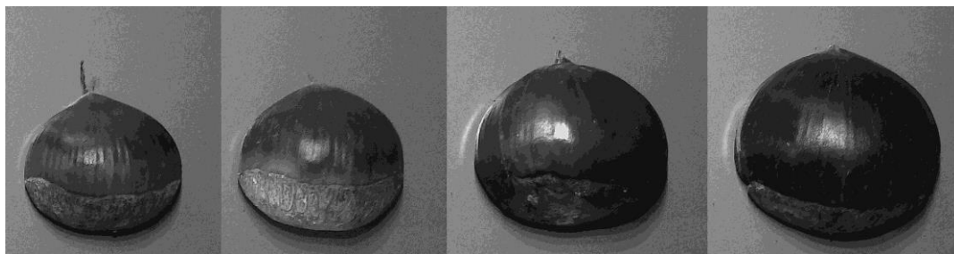
図 3 クリのサイズの例 左から L,2L,3L,4L である。

クリの判別実験では、90%程度の判別率を得ることができた。この実験の結果、簡易な実験でも 90%程度の判別率が得られたことから、外形を用いたクリの大きさ判別に AI 技術を導入することは適していることが分かった。